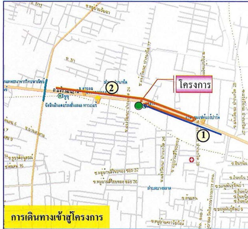
รูปที่ 1-2 เส้นทางคมนาคมเข้า-ออกโครงการ